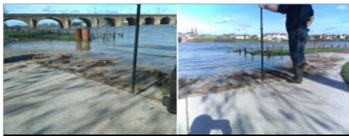
Vues du repère en 2024