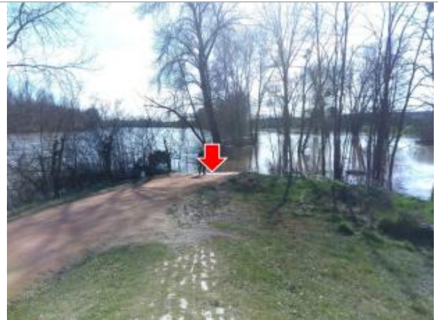
Vue du site en 2024, avec le repère de la crue de mars 2024

Coordonnées WGS84 : X: 3.32559800 / Y: 46.55188200