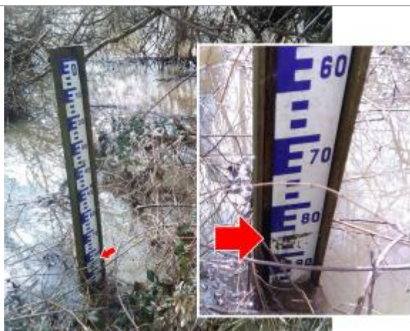
Vue du repère en 2024