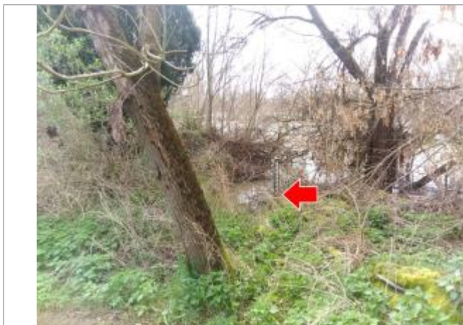
Vue du site en 2024, pendant la crue de mars 2024

Coordonnées WGS84 : X: 3.33637600 / Y: 46.46045300