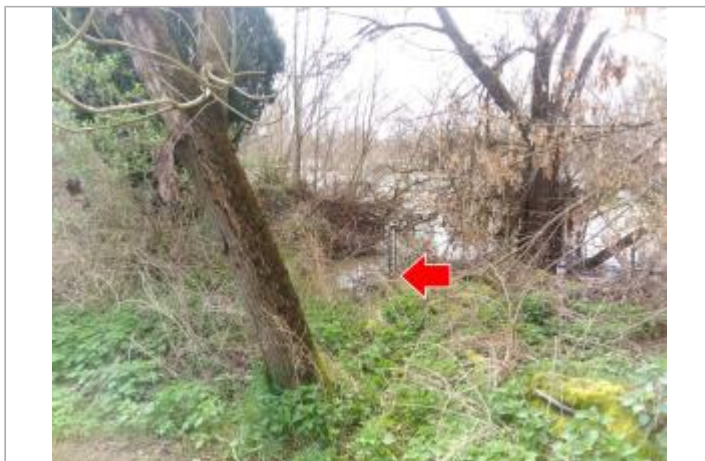
Vue du site en 2024, pendant la crue de mars 2024