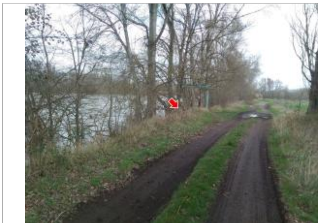
Vue du site en 2024, avec le repère de la crue de mars 2024

Coordonnées WGS84 : X: 3.31945700 / Y: 46.40248300