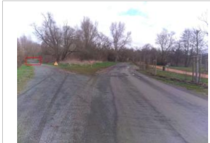
Vue du site en 2024, avec le repère de la crue de mars 2024