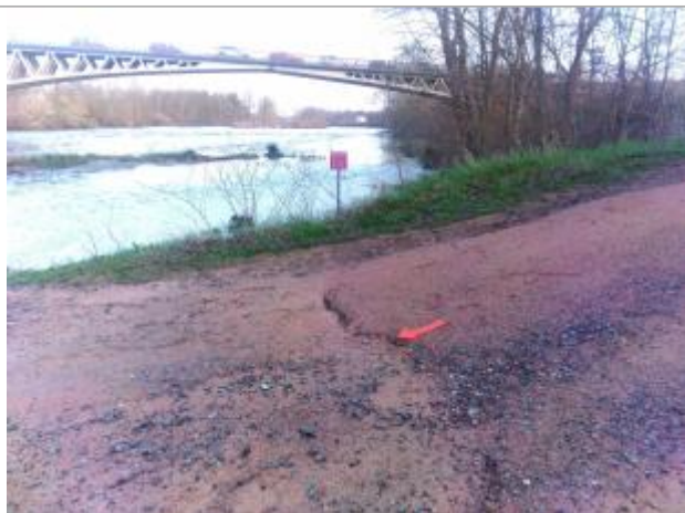
Vue du repère en 2024