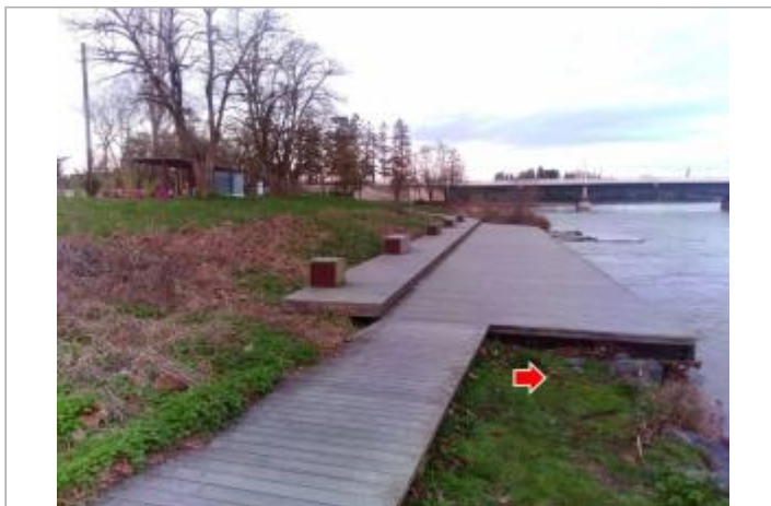
Vue du site en 2024, avec le repère de la crue de mars 2024