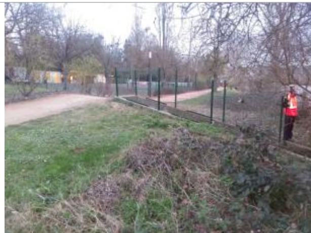
Vue du site en 2024, avec le repère de la crue de mars 2024

Coordonnées WGS84 : X: 3.42429800 / Y: 46.11795900