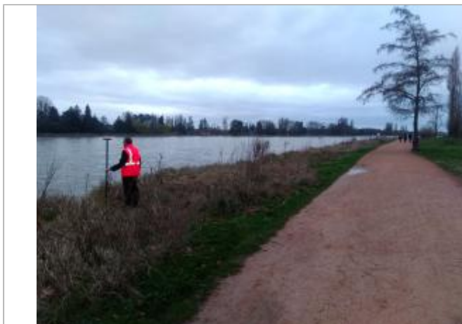
Vue du site en 2024, avec le repère de la crue de mars 2024

Coordonnées WGS84 : X: 3.41545600 / Y: 46.12279500