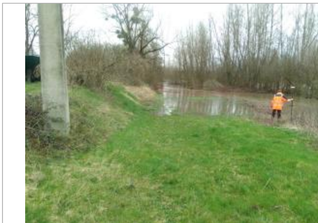
Vue du site en 2024, avec le repère de la crue de mars 2024

Coordonnées WGS84 : X: 3.46177200 / Y: 45.99893000