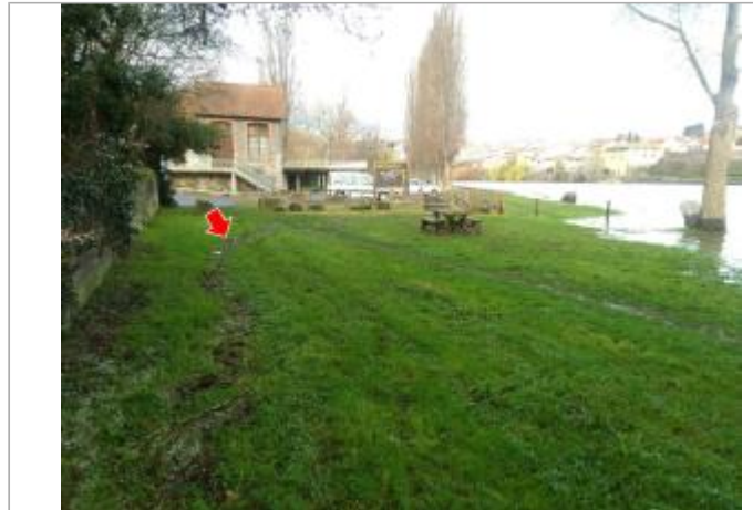
Vue du site en 2024, avec le repère de la crue de mars 2024