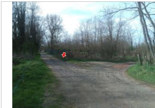
Vue du site en 2024, avec le repère de la crue de mars 2024

Coordonnées WGS84 : X: 3.29438600 / Y: 45.46968200