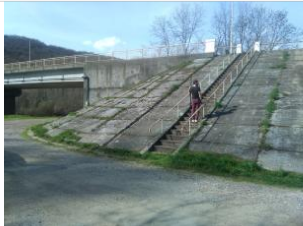
Vue du site en 2024, avec le repère de la crue de novembre 2019