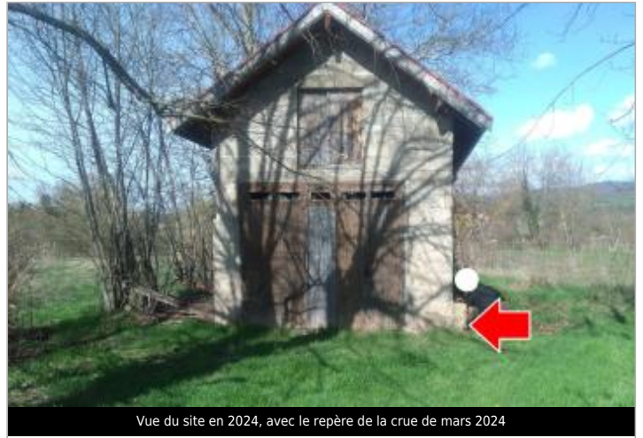
Vue du site en 2024, avec le repère de la crue de mars 2024

Coordonnées WGS84 : X: 3.33406200 / Y: 45.41074600