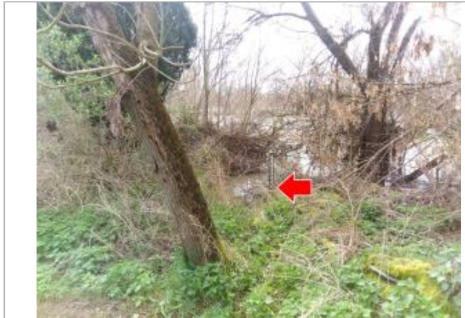
Vue du site en 2024, pendant la crue de mars 2024

Coordonnées WGS84 : X: 3.33637600 / Y: 46.46045300