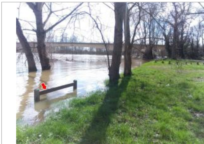
Vue du site en 2024, avec le repère de la crue de mars 2024

Coordonnées WGS84 : X: 3.31738200 / Y: 46.40311200