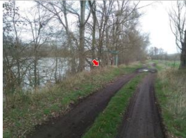
Vue du site en 2024, avec le repère de la crue de mars 2024