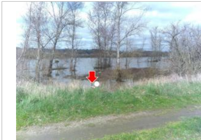
Vue du site en 2024, avec le repère de la crue de mars 2024

Coordonnées WGS84 : X: 3.32272600 / Y: 46.37869500