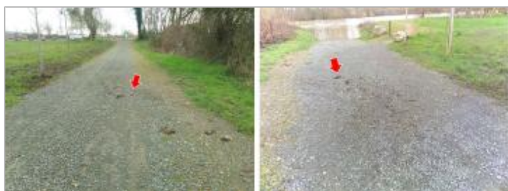
Vues du repère en 2024