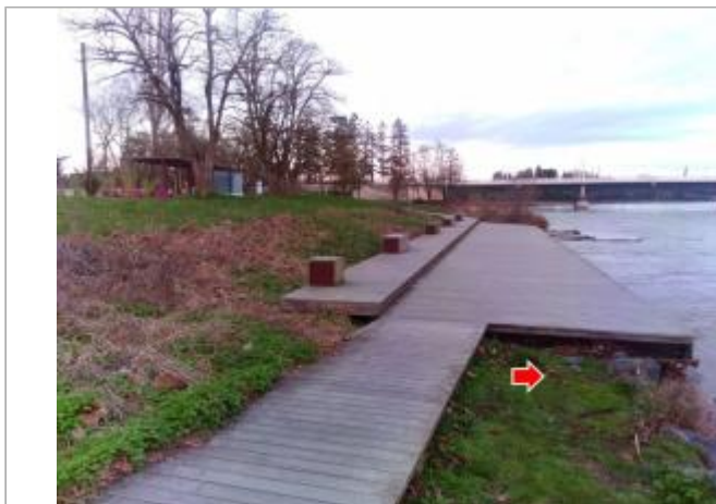
Vue du site en 2024, avec le repère de la crue de mars 2024

Coordonnées WGS84 : X: 3.41785200 / Y: 46.11766800