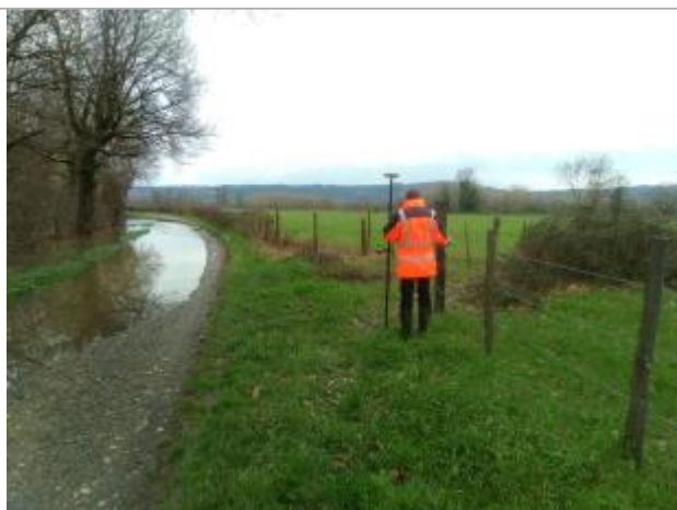
Vue du repère en 2024