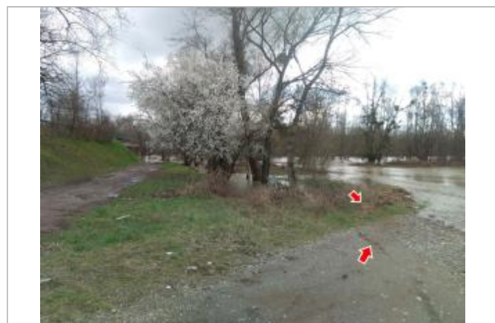
Vue du repère en 2024