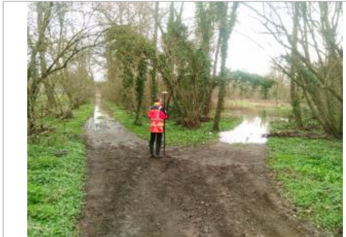
Vue du site en 2024, avec le repère de la crue de mars 2024

Coordonnées WGS84 : X: 3.32653000 / Y: 45.88688900