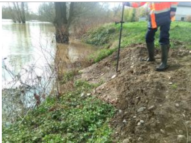
Vue du repère, en 2024