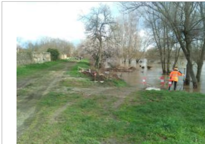
Vue du site en 2024, avec le repère de la crue de mars 2024

Coordonnées WGS84 : X: 3.30503900 / Y: 45.86001300