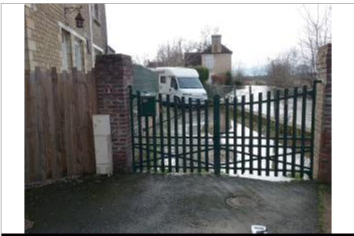
Barrière du n°2, site correspondant au muret à droite de la barrière

GÉOLOCALISATION Coordonnées WGS84 : X: -0.06849200 / Y: 48.92365690 Coordonnées RGF93 (Lambert 93) : X: 475199.61 / Y: 6873665.34 Coordonnées RGF93 (ETRS89) : X: -0.068492 / Y: 48.9236569 Code Hydro: I1--0200 Rive de référence: Droite