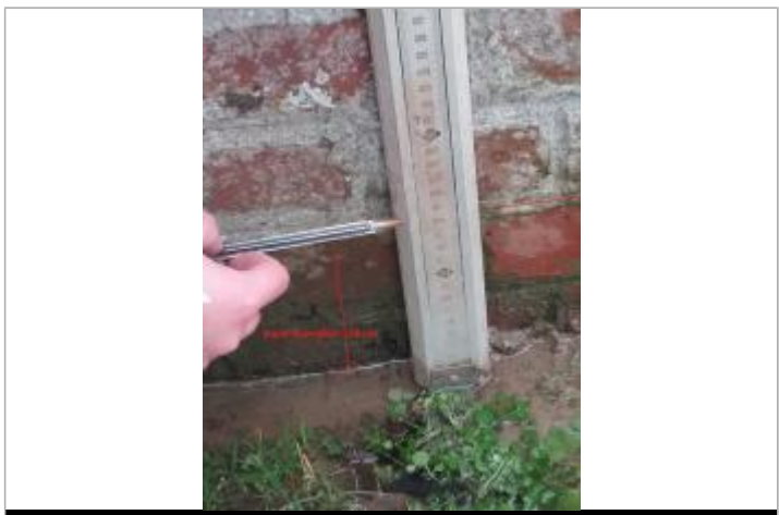
Trace d'humidité sur le muret en brique depuis le sol

MARQUE Texte : Trace d'humidité sur le muret à 14cm par rapport au sol Maximum de l'inondation : Oui Visibilité : Oui État du repère : Bon