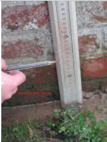
Trace d'humidité sur le muret en brique depuis le sol