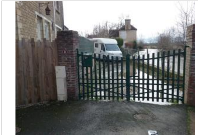
Barrière du n°2, site correspondant au muret à droite de la barrière