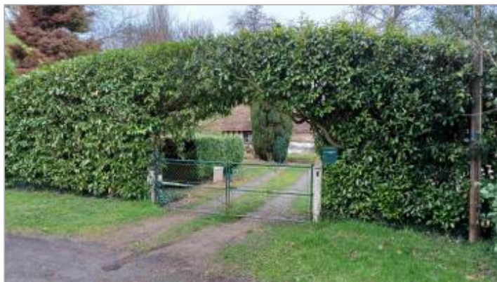
Terrasse de l'habitation au 1 impasse du Catillon

Coordonnées WGS84 : X: 0.71743392 / Y: 49.16063700