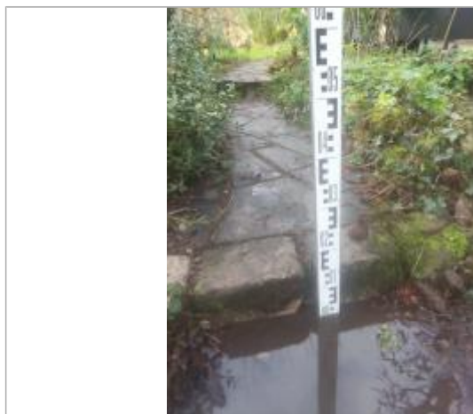
1ère marche avant terrasse - 2cm d'eau - vue rapprochée

NIVELLEMENT SPC SACN. LE SPC N'EST PAS GÉOMÈTRE EXPERT, LES COTES SONT DONNÉES À TITRE INDICATIF. - 16/05/2025