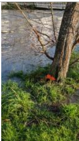
marque au pied de l'arbre -réalisée par le SMBEpte