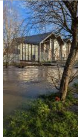
2eme arbre avant le pont du "canal nord" face au lycée Louise Michel