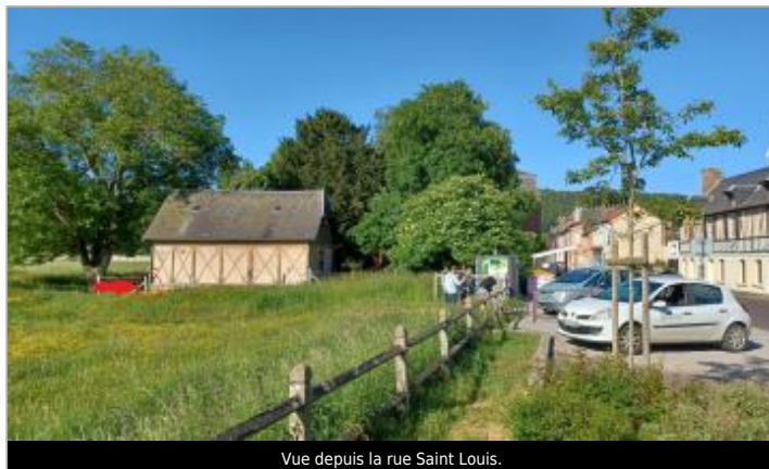
Vue depuis la rue Saint Louis.