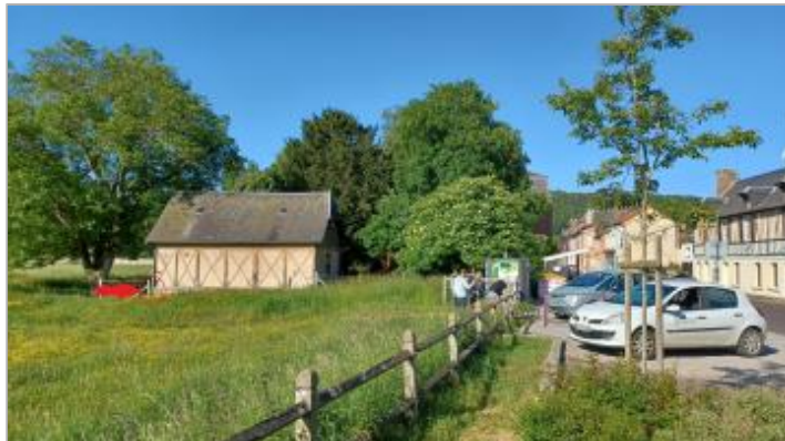
Vue depuis la rue Saint Louis.

Coordonnées WGS84 : X: 0.69789017 / Y: 49.24279560