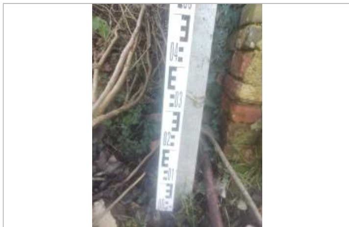
Laisse de crue à 43 cm du sol vue rapprochée

NIVELLEMENT SPC SACN. LE SPC N'EST PAS GÉOMÈTRE EXPERT, LES COTES SONT DONNÉES À TITRE INDICATIF. - 16/05/2025