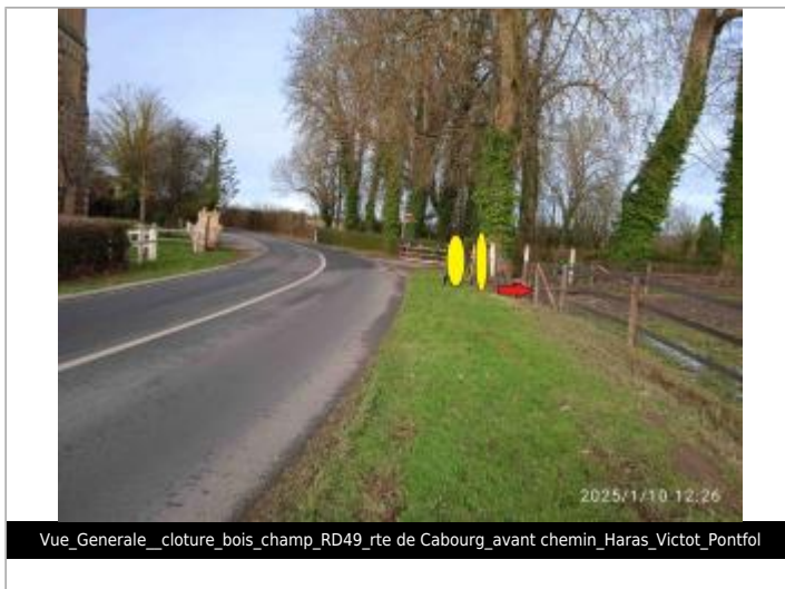
Vue_Generale_cloture_bois_champ_RD49_rte de Cabourg_avant chemin_Haras_Victot_Pontfol