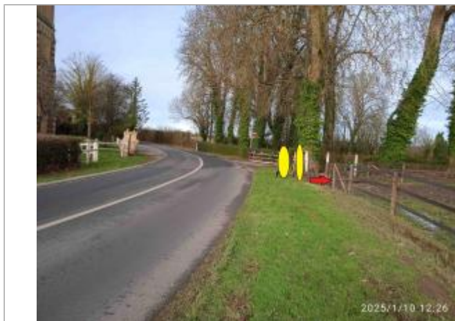
Vue_Generale_cloture_bois_champ_RD49_rte de Cabourg_avant chemin_Haras_Victot_Pontfol

Coordonnées WGS84 : X: -0.01764492 / Y: 49.16512890