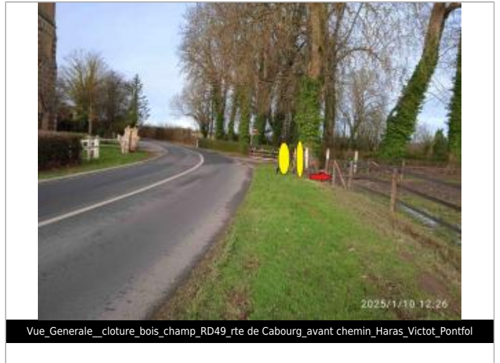
Vue_Generale_cloture_bois_champ_RD49_rte de Cabourg_avant chemin_Haras_Victot_Pontfol

Coordonnées WGS84 : X: -0.01764492 / Y: 49.16512890