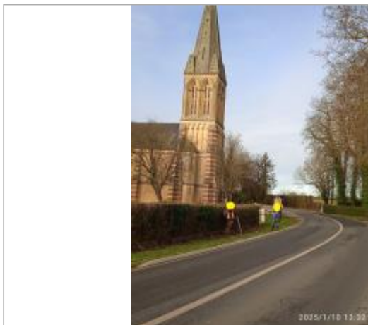
Haie bordure de RD49 à gauche de l'église en arrivant de la Mairie de Victot-Pontfol

Coordonnées WGS84 : X: -0.01774955 / Y: 49.16506890