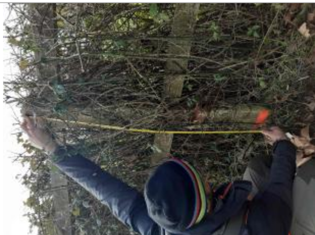
Relevé dépôts végétaux identifiés par une marque peinte sur le poteau ciment dans la haie