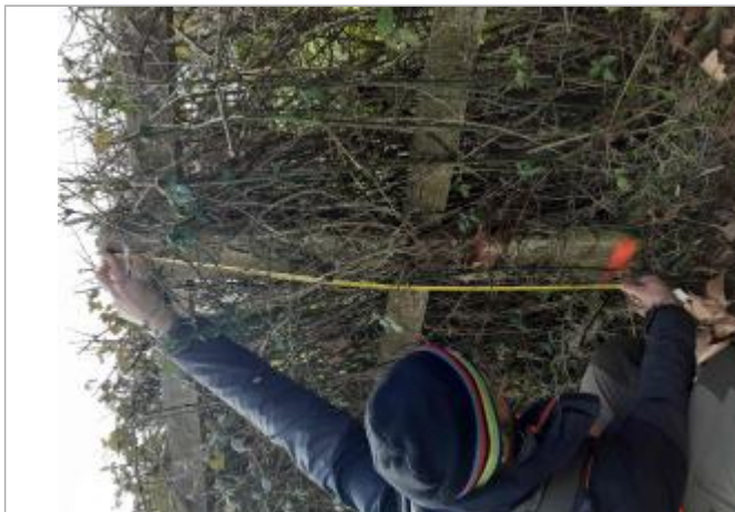
Relevé dépôts végétaux identifiés par une marque peinte sur le poteau ciment dans la haie