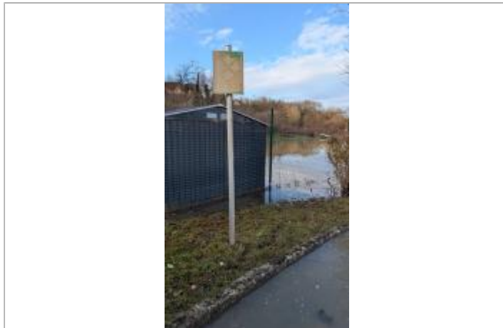
Poteau de cloture du SMBEpte (Syndicat Mixte du Bassin de l'Epte) derrière le point de rassemblement