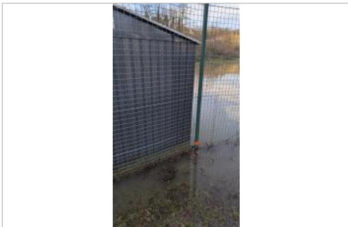
Marque de peinture orange