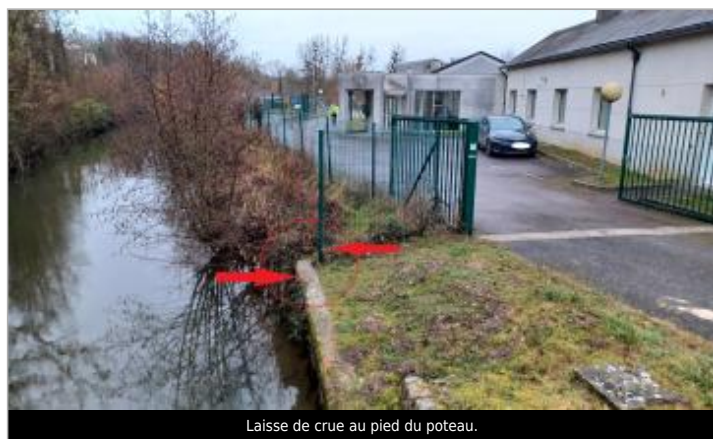
Laisse de crue au pied du poteau.

SOURCE DE REPÉRAGE : VISITE DE TERRAIN SPC SACN - 11/03/2020