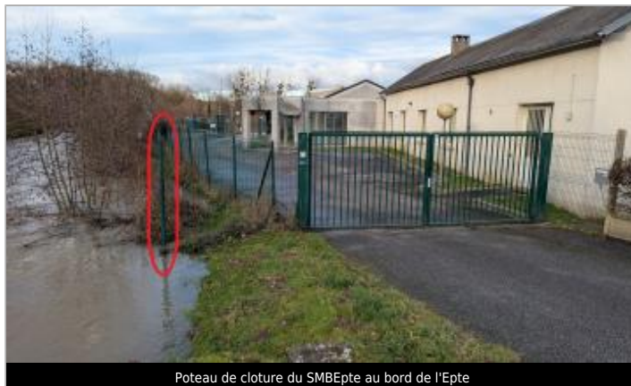
Poteau de clôture du SMBEpte au bord de l'Epte