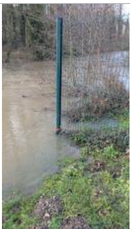
Marque de peinture rose réalisée par le SMBEpte - PHE crue du 10/01/2025

Altitude calculée de l'eau (en m) : 52.42