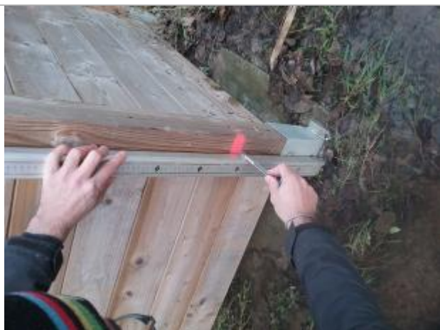
Relevé de la marque peinte depuis la base métal du pied en bois du local poubelles (28,5 cm)