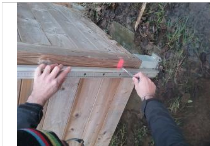
Relevé de la marque peinte depuis la base métal du pied en bois du local poubelles (28,5 cm)