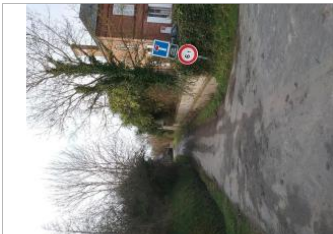
Chemin du Pont Tonnerre, après la Mairie de Victot-Pontfol, et à côté du poste électrique