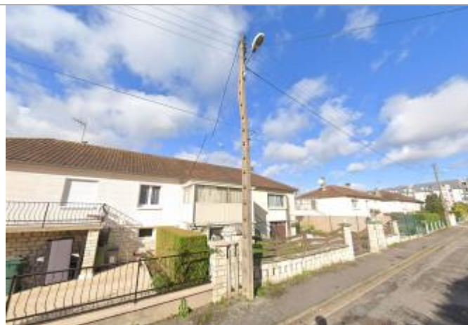
Poteau électrique entre le 12 et le 14 rue René Coty