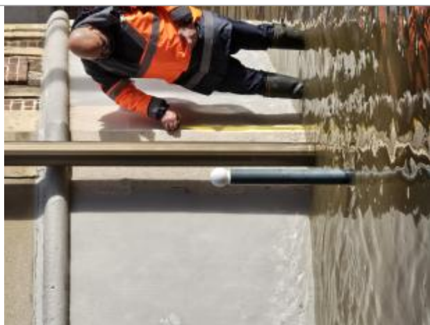
Marque à la craie à 26 cm du sol

Altitude calculée de l'eau (en m) : 50.31 m