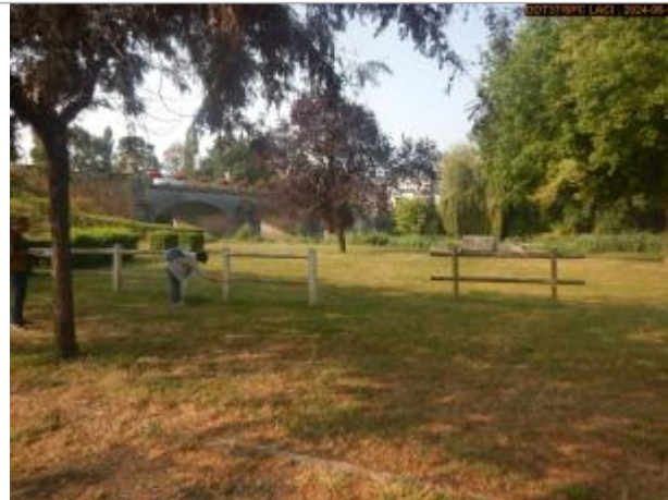
Vue éloignée du site