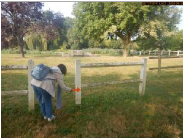
Vue éloignée du repère

Altitude calculée de l'eau (en m) : 53.174 m