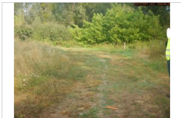
Vue rapprochée de la laisse de crue