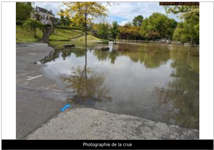
Photographie de la crue