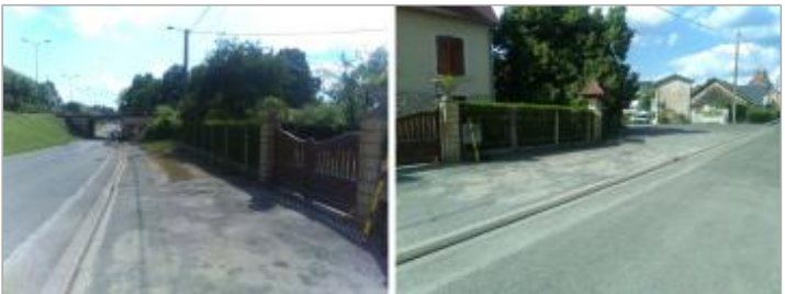
Vue du site en 2024, avec le repère du juin 2024