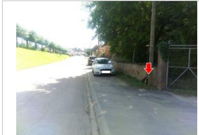
Vue du site en 2024, avec le repère du juin 2024

Coordonnées WGS84 : X: 2.48553935 / Y: 46.72412918