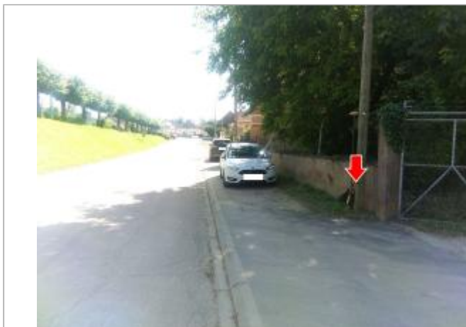
Vue du site en 2024, avec le repère du juin 2024