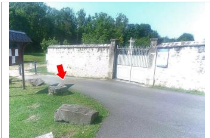
Vue du site en 2024, avec le repère du juin 2024