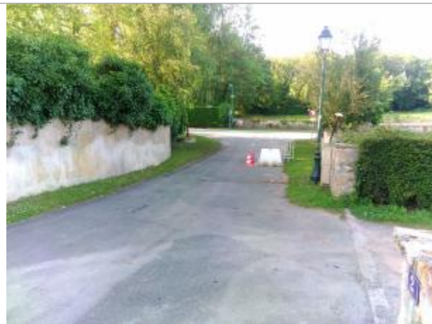
Vue du site en 2024, avec le repère du juin 2024