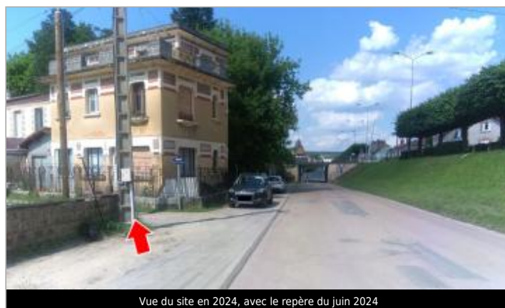
Vue du site en 2024, avec le repère du juin 2024

GÉOLOCALISATION Coordonnées WGS84 : X: 2.48525309 / Y: 46.72394716 Coordonnées RGF93 (Lambert 93) X: 660686.6 / Y: 6624999.26 Coordonnées RGF93 (ETRS89) : X: 2.4852531 / Y: 46.7239472 Code Hydro: K5444000 Rive de référence: Droite