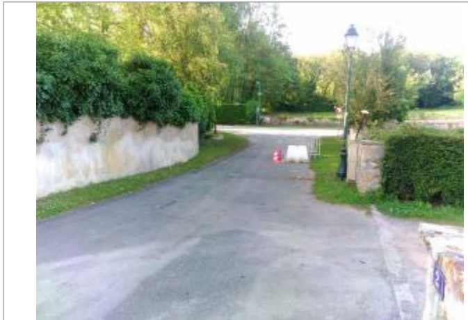
Vue du site en 2024, avec le repère du juin 2024

Coordonnées WGS84 : X: 2.47810185 / Y: 46.72296841