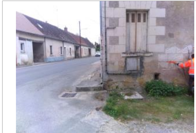
Vue du site en 2024, avec le repère de la crue de fin mars 2024

Coordonnées WGS84 : X: 1.22078400 / Y: 47.09147200