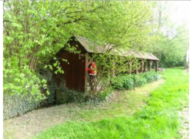
Vue du site en 2024, avec le repère de la crue de fin mars 2024

Coordonnées WGS84 : X: 1.29490300 / Y: 47.02150400