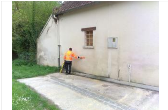
Vue du site en 2024, avec le repère de la crue de fin mars 2024